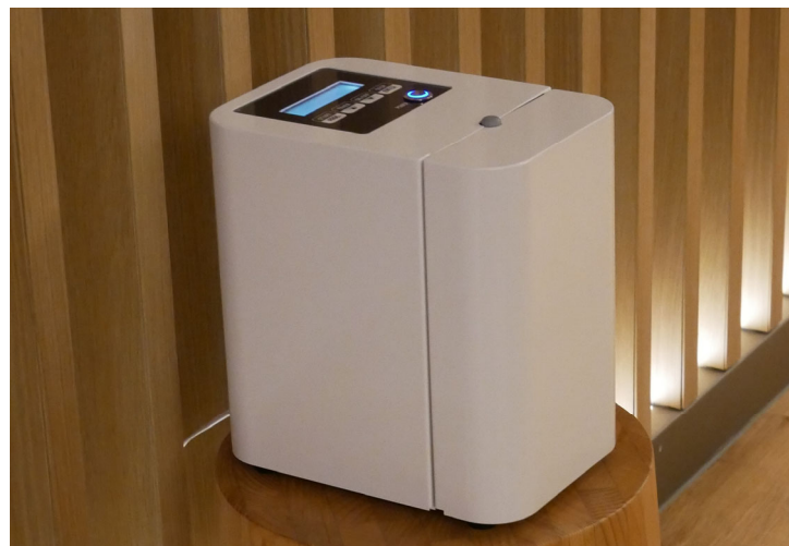
【本年7月発売の「ジアスペース1000」】

なお、本年3月の「ジアスペース」発表時にはお引き合いが集中し欠品でご迷惑をお掛けしたことから、「ジアスペース1000」につきましては、本年7月発売後遅滞なくお届けするために本日より「予約申込み」を開始するとともに、従来の「ジアスペース」につきましても5月・6月生産分のお申し込みを先着順にて引き続き受け付けております。ご希望の方は、お早めにお問合せ下さい。